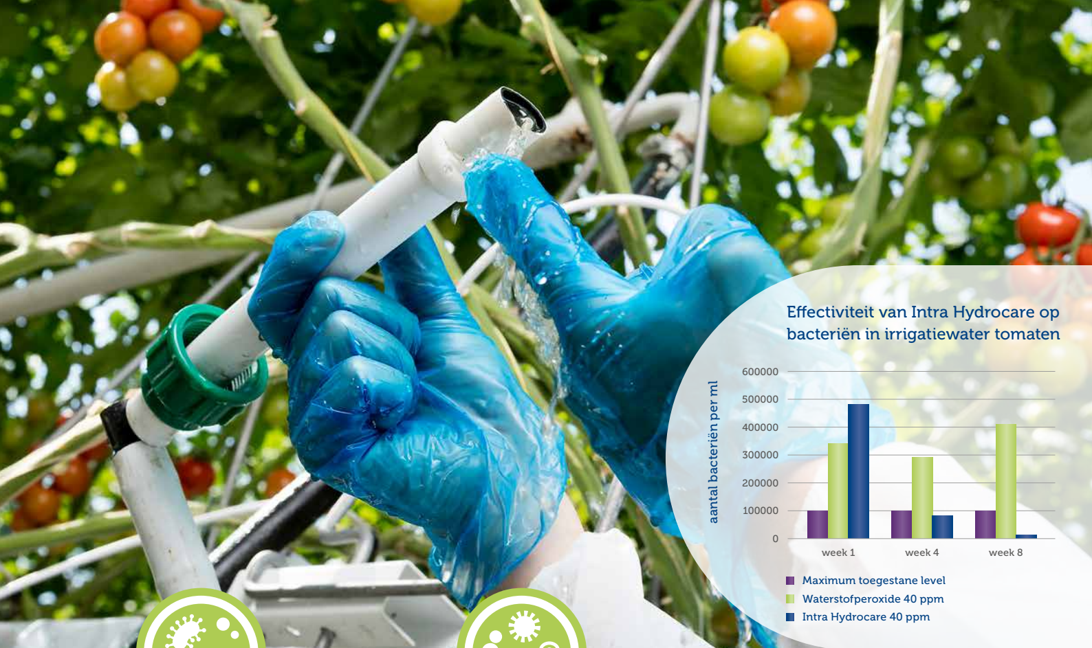
Effectiviteit van Intra Hydrocare op bacteriën in irrigatiewater tomaten